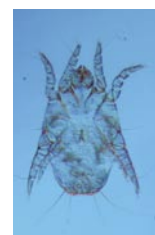
ヤケヒョウヒダニ 雄成虫