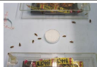
忌避効果試験（チャバネゴキブリ）

ゴキブリ、イエバエなどの衛生害虫や不快害虫に対する忌避効果試験、殺虫力試験も行っております。対象生物によっては試験できない場合がございますので、詳しくは、お問い合わせください。