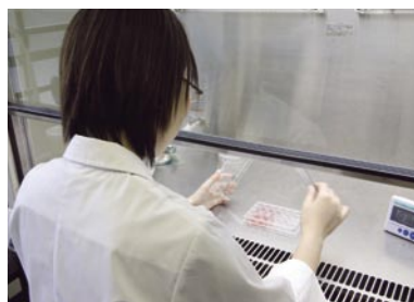
培養皮膚モデルによる皮膚刺激性試験