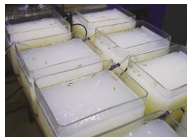
魚毒急性毒性試験（ヒメダカ）